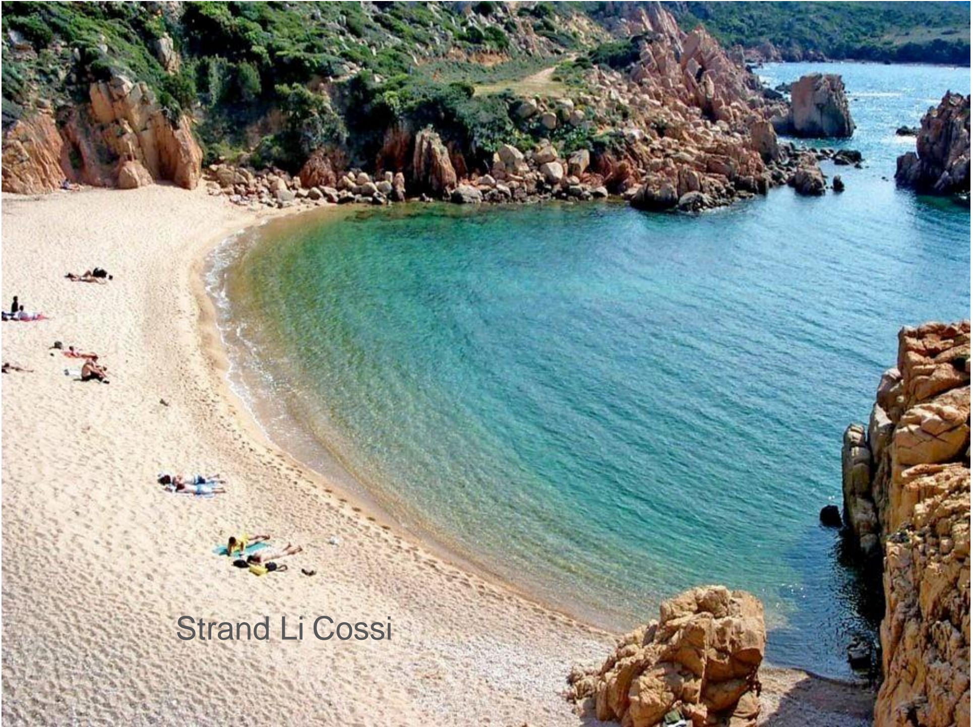
Strand Li Cossi